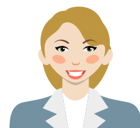
SALARIÉS EN MUTATION