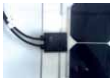
CONNEXION: JUNCTION BOX