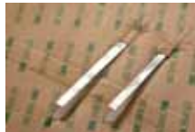
CONNEXION: SOUDAGE DIRECT RIBBON